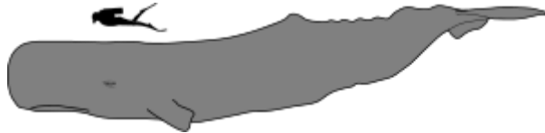
Größenvergleich Pottwal und Taucher

Mt 12,39-40 Jesus vergleicht seine Zeit im Grab mit der Zeit Jonas im Fisch.